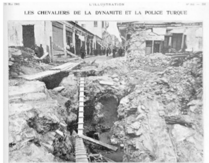
Рицарите на динамита и турската полиция Тунелът, изкопан от българските атентатори за взривяването на Отоманската банка в Солун.

По някакво съглашение между българското и турското правителства, българското правителство се задължило да интернира във вътрешността на страната немирните елементи измежду македонската и