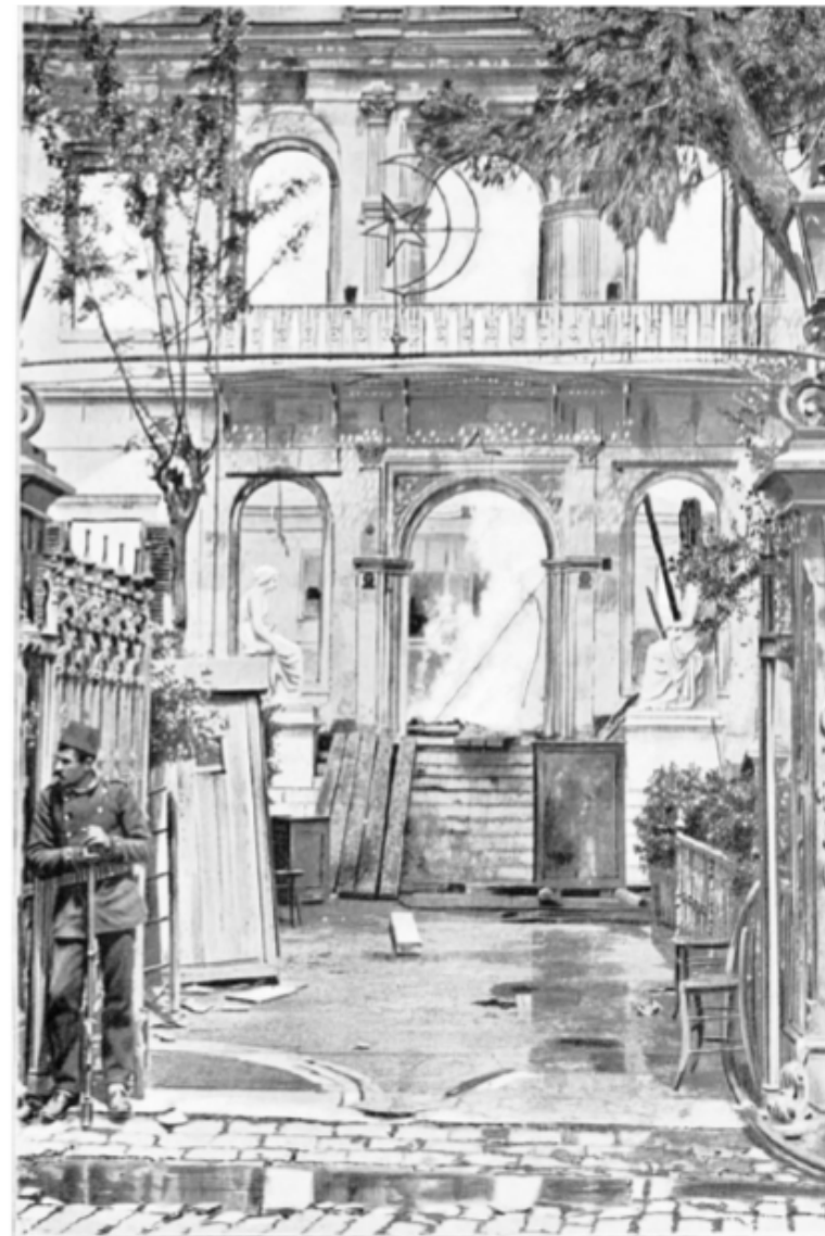
Взривената Отоманска банка сп. Л'Илюстрацион, бр. 3142, 16 май 1903 г.