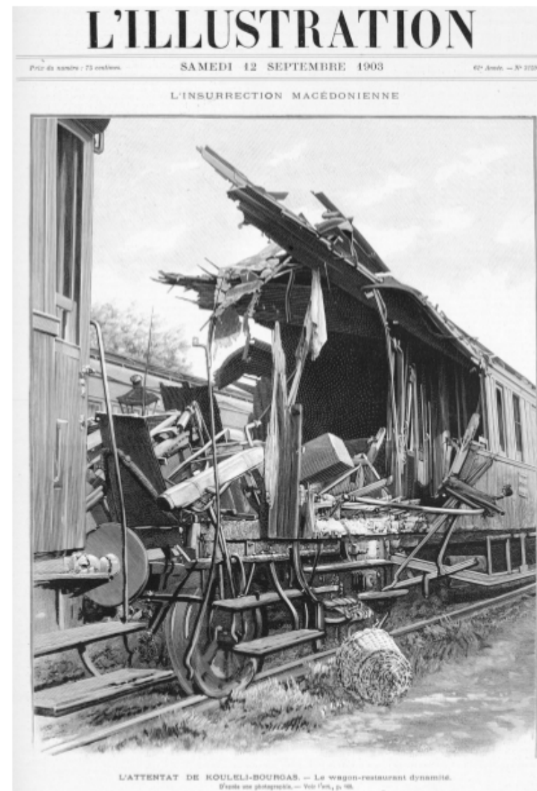
АТЕНТАТЪТ В КУЛЕЛИ-БУРГАС Взривеният вагон-ресторант СП. Л'ИЛЛЮСТРАЦИОН, БР. 3159, 12 СЕПТЕМВРИ 1903 Г.

Губернаторът, валията Хасан Фетми-Паша, се отличи и заслужи за всичките похвали. Той още сутринта, след станалите експлозии, се яви на много места, за да успокоява публиката, като я уверяваше, че войската и административната власт ще могат да запазят реда