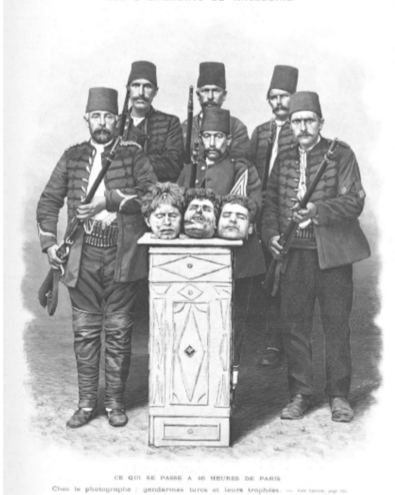
CE QUI SE PASSE À 40 HEURES DE PARIS

Chez le photographe : gendarmes turcs et leurs trophées. — (voir page 3130)