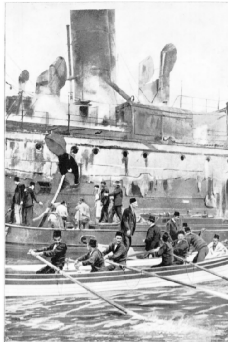
ВЗРИВЕНИЙТ ПАРАХОД „ГАДААКИВИР“ сп. А' ИАЮСТРАСНОН, БР. 3142, 16 МАЙ 1903 Г.

Мандито, който знаеше, че понякога ме прихващаше мерака на стихобесието, позеленяваше от яд и влизаше с мене в пазарлък: